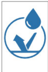
RESISTENTE A LA HUMEDAD